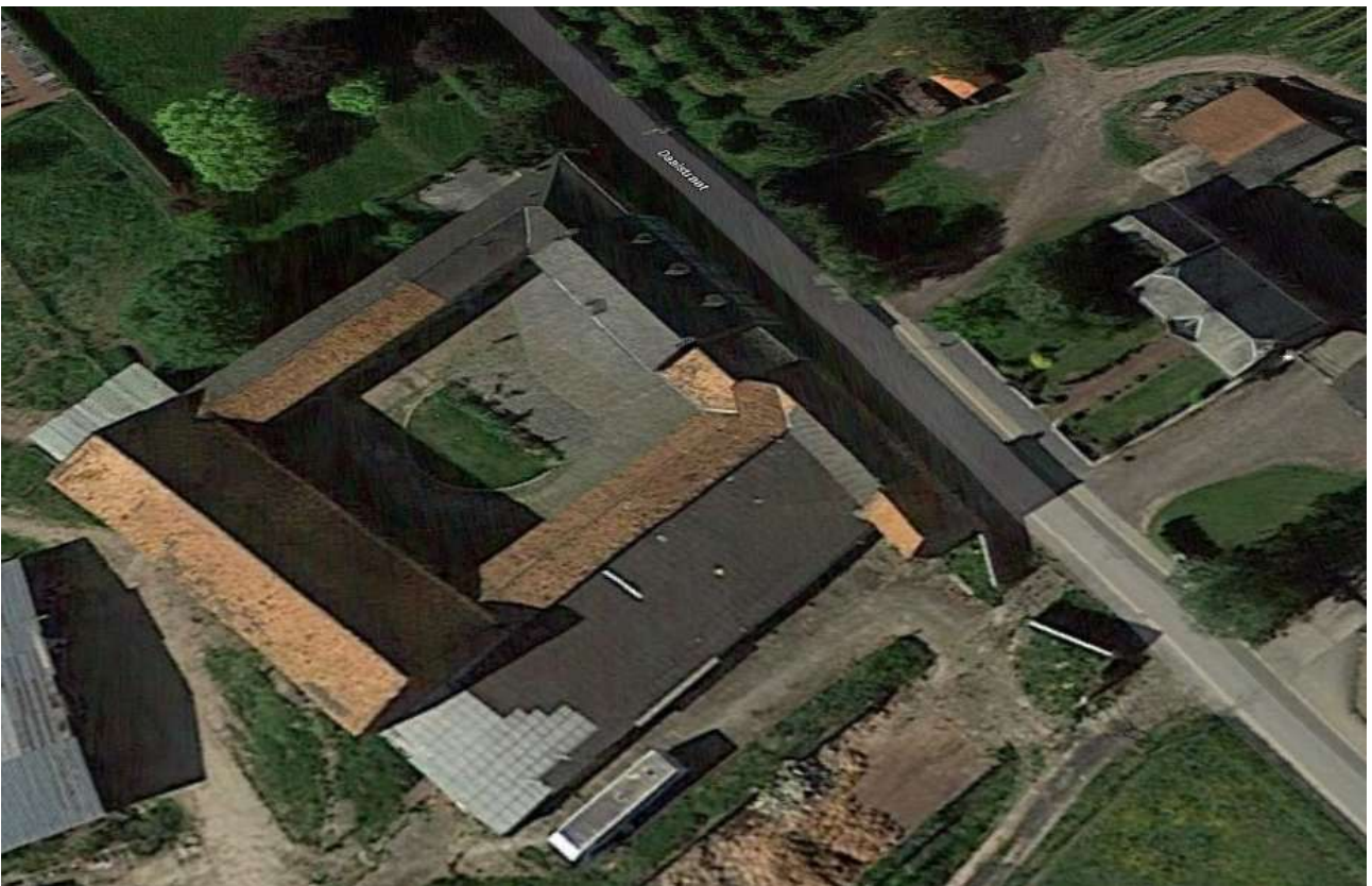
De Hoeve Renaerts – Google streetview.